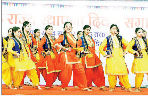
रजत जयंती के अवसर पर स्कूली बच्चों की प्रस्तुति।

छत्तीसगढ़ राज्य स्थापना दिवस के रजत जयंती वर्ष के अवसर पर जिला मुख्यालय स्थित शहीद कर्नल विप्लव त्रिपाठी स्टेडियम में आयोजित जिला स्तरीय राज्योत्सव कार्यक्रम के दूसरे दिन विविधतापूर्ण सांस्कृतिक प्रस्तुतियों ने समूचे परिसर को लोक संस्कृति और उत्साह के रंगों से भर दिया। स्कूली छात्र-छात्राओं द्वारा प्रस्तुत लोकनृत्य, नाट्य और संगीत कार्यक्रमों ने दर्शकों को मंत्रमुग्ध कर दिया। कार्यक्रम की शुरुआत घरघोड़ा के विद्यार्थियों द्वारा आकर्षक आदिवासी नृत्य से हुई, जिसने राज्य की लोकपरंपरा का जीवंत प्रदर्शन किया। इसके बाद विद्या विकास कॉन्सेप्ट स्कूल के विद्यार्थियों ने वैदिक नृत्य के माध्यम से भारतीय संस्कृति की आध्यात्मिक झलक पेश की। ओपी जिनदल स्कूल सावित्री नगर के विद्यार्थियों ने मिशन सिंधु पर आधारित नाटिका के जरिए सामाजिक समरसता का संदेश दिया। चक्रधर बाल सदन के बच्चों ने रामायण थीम पर सुंदर नृत्य प्रस्तुति दी, जबकि कन्या