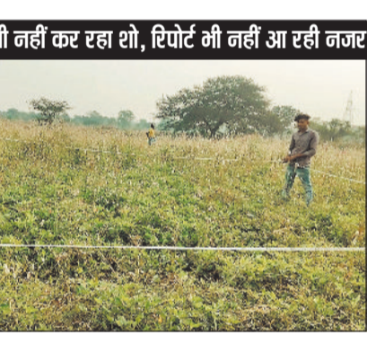
सापटवेयर में कुछ भी नहीं कर रहा शो, रिपोर्ट भी नहीं आ रही नजर

धान खरीदी चालू हो जाएगी, लेकिन दर्जनों किसान ऐसे हैं जिनका रकबा या तो शून्य दिखा रहा है या धान के बदले कुछ अन्य फसल। ऐसे किसानों की चिंता बढ़ गई है। सुधार हो गया तब तो ठीक है, लेकिन नहीं हुआ तो मुसीबत बढ़ सकती है। इस