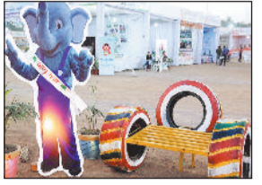
कबाड़ से बना मशीन गन मॉडल और ईरिवथा बने आकर्षण का केंद्र