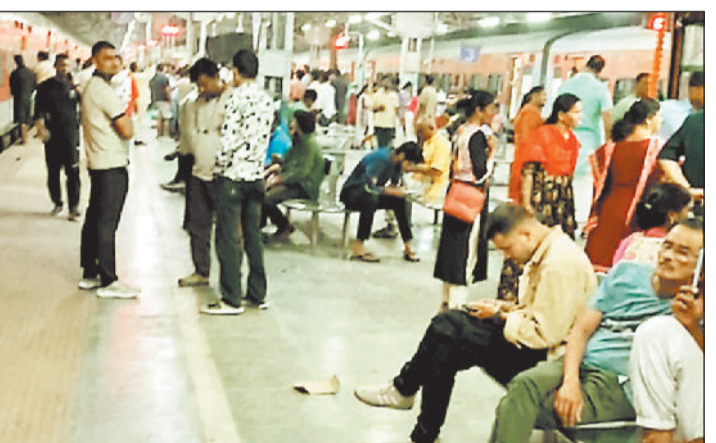
हरिभूमि न्यूज ►► रायगढ़

बिलासपुर के पहले गतौर के पास हुए ट्रेन हादसे का असर रायगढ़ में भी देखने को मिला। लाइन क्लियर नहीं होने की वजह से रेलवे प्रशासन ने ट्रेनों को अपने कंट्रोल में ले लिया। जिससे कोतरलिया स्टेशन में अप दिशा की ओर जाने वाली साउथ बिहार व रायगढ़ स्टेशन में हीराकुंड व दुरंतो एक्सप्रेस घंटों खड़ी रही। इससे यात्रियों को काफी परेशानियों का सामना करना पड़ा। दरअसल मंगलवार की शाम करीब 4 बजे बिलासपुर जिले में कोरबा पैसंजर ट्रेन और एक मालगाड़ी के बीच जोरदार टक्कर