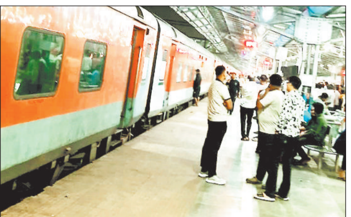
हरिभूमि न्यूज ►► रायगढ़

बिलासपुर के पहले गतौर के पास हुए ट्रेन हादसे का असर रायगढ़ में भी देखने को मिला। लाइन क्लियर नहीं होने की वजह से रेलवे प्रशासन ने ट्रेनों को अपने कंट्रोल में ले लिया। जिससे कोतरलिया स्टेशन में अप दिशा की ओर जाने वाली साउथ बिहार व रायगढ़ स्टेशन में हीराकुंड व दुरंतो एक्सप्रेस घंटों खड़ी रही। इससे यात्रियों को काफी परेशानियों का सामना करना पड़ा। दरअसल मंगलवार की शाम करीब 4 बजे बिलासपुर जिले में कोरबा पैसंजर ट्रेन और एक मालगाड़ी के बीच जोरदार टक्कर